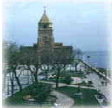
Thermes romains à Gijon